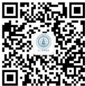
西安交通大学成人高等教育 微信公众号

5. 考试前学院会通过“西安交通大学成人高等教育”微信公众号发布“考生提示”，对考试要求、疫情动态等考试相关事项进行说明，请考生扫码关注。